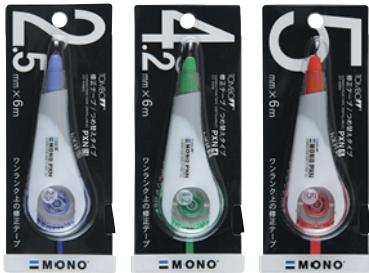
CT-PXN2.5 テープ幅 2.5mm | 長さ 6m CT-PXN4 テープ幅 4.2mm | 長さ 6m CT-PXN5 テープ幅 5mm | 長さ 6m