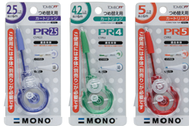
CT-PR2.5 テープ幅 2.5mm | 長さ 6m CT-PR4 テープ幅 4.2mm | 長さ 6m CT-PR5 テープ幅 5mm | 長さ 6m